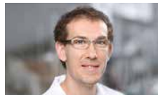
Altergott Oleg Wasseranalytik