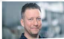
Humm Micha Hygienemonitoring, HACCP, Arbeitssicherheit