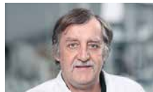
Grosjean Georg Umweltanalytik