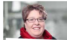
Kistler Denise Managementsysteme, Audits