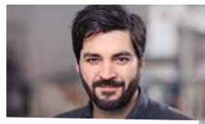
Hartmann Herbert Hygienemonitoring, HACCP, Lebensmittelrecht